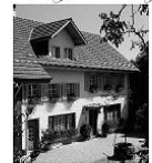
Familienbetrieb seit 1898

gemeinsames Mittagessen – gesunder Jägerhuus-Standard und wie gewohnt zu einem Spezialpreis von ca. 20 Franken